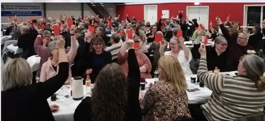
GENERALFORSAMLING I HOLSTEBRO DEN 23. MARTS 2022