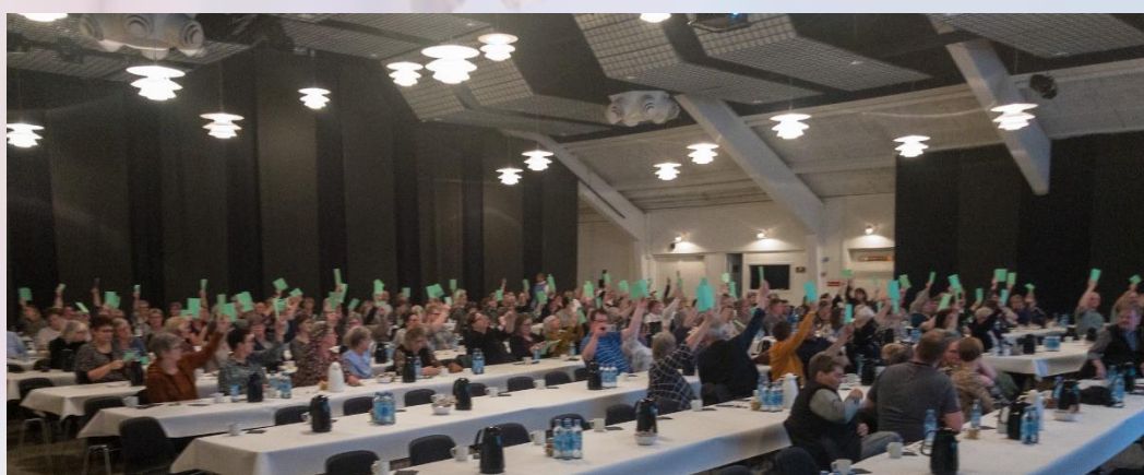
GENERALFORSAMLING I HERNING DEN 23. MARTS 2022